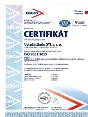
Certifikát VŠ o zavedení a používaní systému manažérstva kvality podľa novej normy ISO 9001:2015

Certifikát o zavedení a používaní systému manažérstva kvality podľa novej normy ISO 9001:2015 každoročne Vysoká škola DTI úspešne obhajuje.