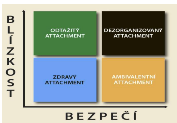
Obr. 3 Jednotlivé typy attachmentu rozdelené do 4 kvadrantov

d) Dezorganizovaná vzťahová väzba – sa vyznačuje chaotickými reakciami rodiča, ktorý je vo vzťahu k dieťaťu pasívny, bez záujmu uspokojiť jeho potreby. Tento typ je príznačný pre deti zneužívané a týrané, ktorý chýba nielen zdravá vzťahová väzba, ale často prežívajú pocit chaosu, lebo si nedokážu vysvetliť dôvody konania rodiča voči nim. Podvedome si vytvára ideálny obraz svojho rodiča, od ktorého by cítilo lásku, pozornosť, ale takýmto spôsobom si iba dezorganizovane fixuje nekvalitný model správania, ktorý môže uplatniť vo svojich medziľudských vzťahoch (Bowlby, 2010).